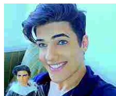
Addio al Ken umano, il modello brasiliano che amava le bambole /Foto