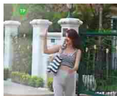
Un pene finto per prevenire le aggressioni, boom in