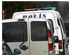
"Voleva fare come nei porno tedeschi": donna turca taglia la testa al