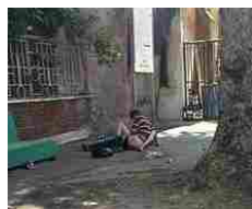
Roma, sesso in strada tra i rifiuti nel cuore di Trastevere