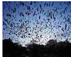
Più potente dell'insetticida e totalmente green,

4. Si è risvegliato il lander Philae della sonda Rosetta, era in 'letargo' da 7 mesi