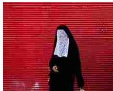
Fatwa obbliga le donne musulmane a fare sesso con il marito "anche su