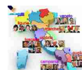
Amministrative 2015, speciale Adnkronos - A cura di Cristiana Deledda e Francesco Saita