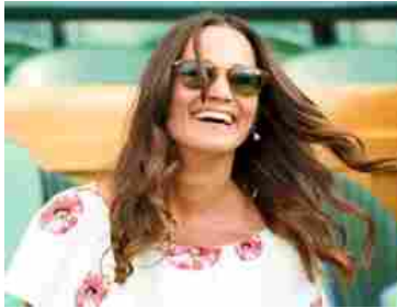
Social, Hackerate le foto "intime" di Pippa Middleton