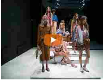
Milano moda, la sfilata di Tod's nel segno del grande Cinema