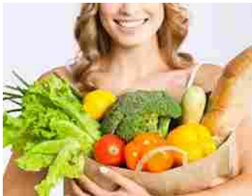
Allarme dentisti, no a diete vegane o crudiste "fai da te"

galleggiano negli oceani di tutto il pianeta che possano arrivare ad occupare una superficie totale pari a circa 16 milioni di chilometri quadrati. L' 11 aprile 2013 a Parigi, nella sede dell'Unesco, Maria Cristina Finucci ha simbolicamente ufficializzato l'opera "Garbage Patch State" come una vera e propria Nazione, dotata di bandiera, costituzione, leggi e ambasciate per richiamare l'attenzione sulla minaccia ambientale rappresentata da questo fenomeno.